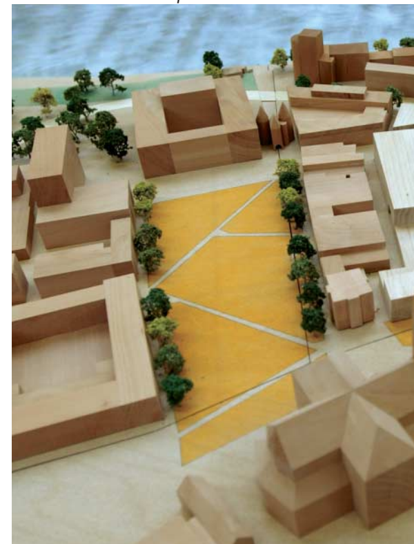
De Markt en het Kerkplein met rechts de haven

In de eerste fase van het plan Rijnboog wordt de haven aangelegd. Dat wordt dé blikvanger voor het centrum. De Rijn is nu nog onzichtbaar vanuit de stad. Met de aanleg van een stadshaven van 40 bij 220 meter op de plaats van de huidige Nieuwstraat wordt dit resoluut anders. De Rijn komt straks tot in het historische hart van de stad. Vanuit de omliggende straten en pleinen komend ervaar je altijd het water van de rivier. De haven is toegankelijk voor boten. Aangemeerde schepen zorgen ervoor dat er altijd wat te kijken valt. Door de aanleg van de haven krijgt Arnhem meer kades en gebouwen die direct aan het water grenzen. Aansluitend op de haven wordt een eerste deel van de Rijnkade vernieuwd. Flaneren, terrasje pakken, kijken naar het water... nu al heeft de Rijnkade grote aantrekkingskracht, maar de inrichting kan veel beter. Het weggedeelte voor verkeer wordt alleen toegankelijk voor woonverkeer. Zo blijft er ruimte over voor een brede wandelstrook. Ook de terrassen kunnen uitbreiden. Grote platforms komen boven de lage kade te hangen en misschien dat enkele ingericht worden als glazen paviljoens.