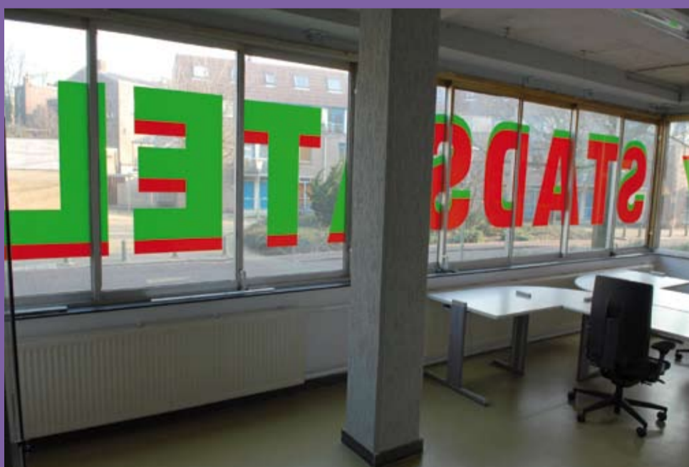
Het Stadsatelier aan de Kleine Oord 179 in de Arnhemse binnenstad. Het is dé plek voor inlooppiddagen, lezingen, presentaties, publieke brainstorms, informatiesessies en andere meetings over Arnhemse gebiedsontwikkelingen. Natuurlijk de Rijnbooggebieden waaronder het Havenkwartier, Paradijs en Bartok, maar ook Stadsblokken-Meinerswijk. Voor professionals en publiek. Het Stadsatelier heeft geen reguliere openingstijden. Binnenlopen kan wél op momenten van georganiseerde tentoonstellingen en diverse bijeenkomsten. Let op de aankondigen op www.rijnboog.nl