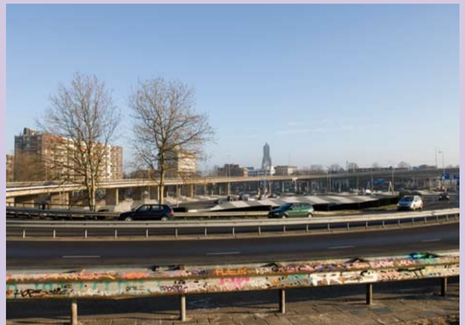
‘Binnenkort start het participatie-proces voor de drie deelgebieden ‘de Krul’, ‘Coehoorn-Zuid’ en ‘Coehoorn-Noordwest’. Voor deze deelgebieden worden mogelijke scenario’s ontwikkeld, binnen de ambities van het Masterplan Rijnboog. Verder ligt alles nog open.

Dit is de eerste aflevering in een serie over de culturele instellingen in het Cultuurcluster