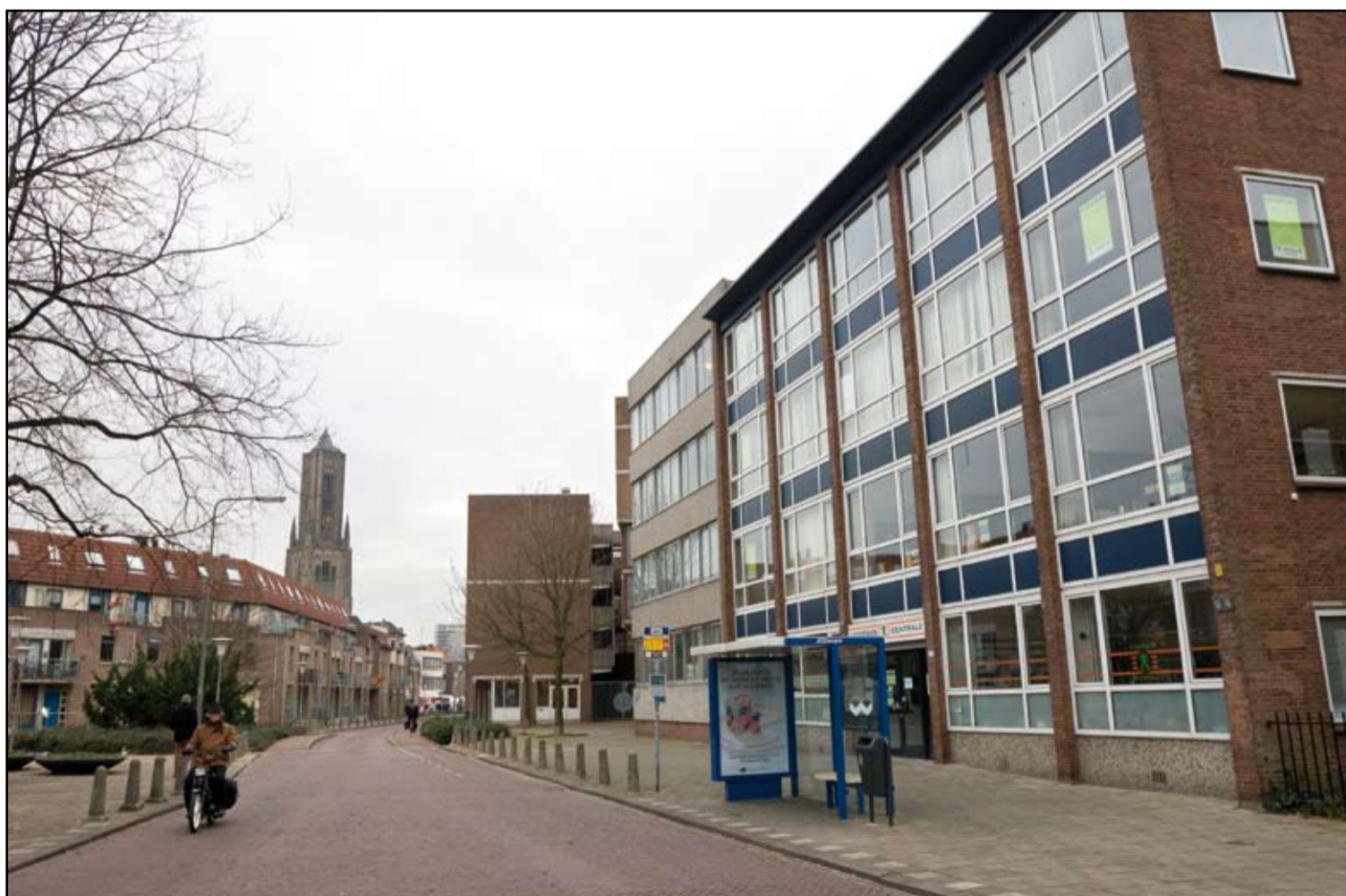
Op termijn staat hier een mooi nieuwbouwblok met zestig appartementen

dan aan staal, de ander aan grote betonnen vlakken. Bartok wordt in ieder geval een gebied op menselijke maat, en het krijgt een warme uitstraling. We willen een verticale geleiding, zoals je dat ook aan oude pandjes ziet. Die zijn meestal smal, allemaal anders, een aantal verdiepingen hoog. Dat ritme in de gevels willen we overnemen. Van binnen worden de appartementen natuurlijk modern en helemaal van deze tijd.”