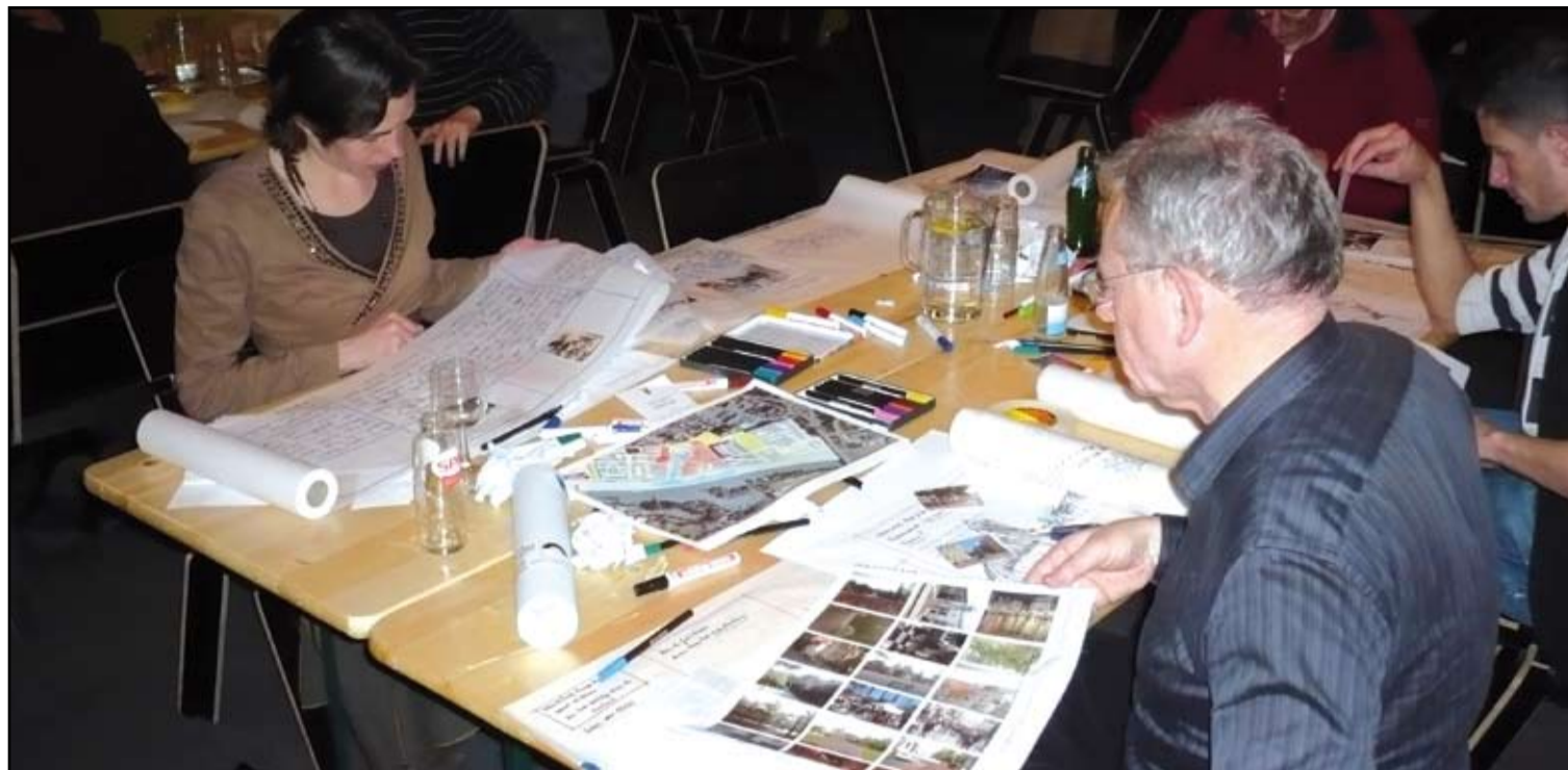
Impressie van twee creatieve sessies over het Havenkwartier in april