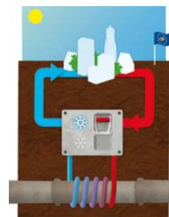
Seweex zomer: het koude rioolwater koelt gebouwen