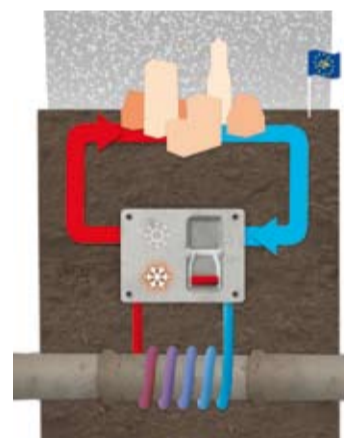
Seweex winter: de warmte uit het riool verwarmt Rijnboog