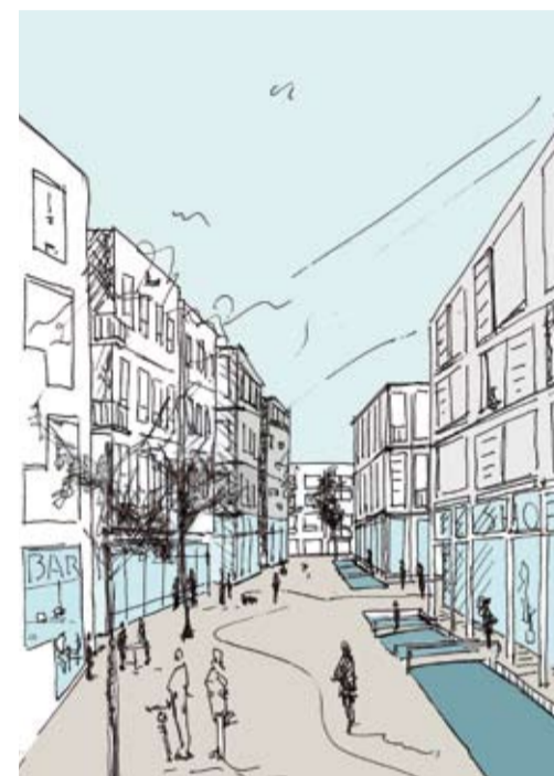
Schets van de Jansbeek door de Turfstraat vanaf de Rodenburgstraat. Rechts nieuwe bebouwing op het Kerkplein (Urahn Urban Design).

De meest actuele informatie vindt u op www.rijnboog.nl , of meld je aan voor de digitale nieuwsbrief