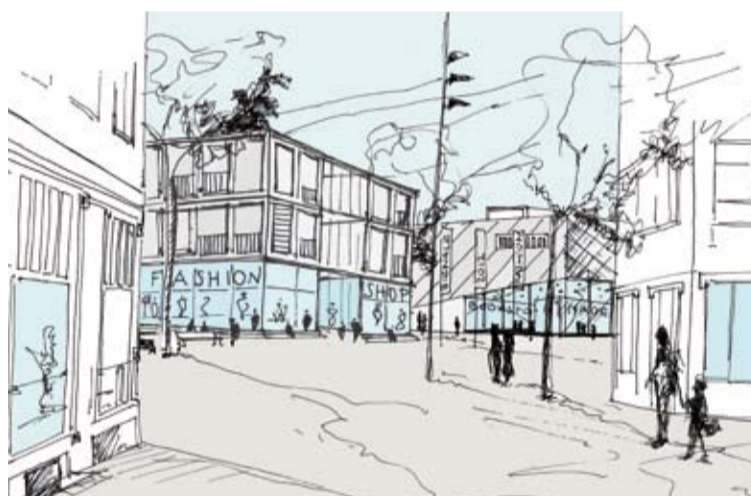
Schets van het nieuwe plein op de kop van de Nieuwstraat gezien vanuit de Weverstraat (Urahn Urban Design).