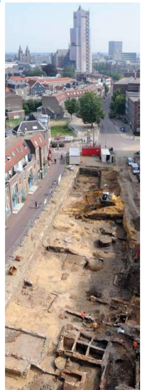
De locatie, waar dagelijks veel mensen kwamen kijken.

De beerputten die bij deze huizen liggen zijn opvallend groot. Voor de stadsarcheoloog zijn het schatkamers. Van den Berghe: ‘We halen zó drie meter museum uit de grond. Kookgerei uit de late middeleeuwen. Speelgoed, kammen en medicinale voorwerpen. Echt een museale vondst is de boerendanskruik uit België. Met dansende figuurtjes erop, en een regel tekst met de strekking ‘bezint eer ge begint’. Helemaal bijzonder zijn de drie vrijwel puntgave drinkbekers uit Siegburg (Duitsland) Ze zijn in opdracht gemaakt. Op de bekers zijn familiewapens te zien. Eén van de bekers heeft zelfs het wapen van Arnhem.’ Van den Berghe: ‘We hebben keihard gewerkt met heel veel vrijwilligers. Zo vonden we 16e eeuwse kelders. We ontdekten dat de Rijn hier vroeger stroomde en wat hier voor bedrijvigheid was. Alles van