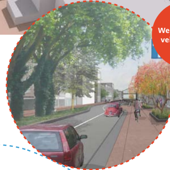
De Weerdesstraat wordt een prettig ingerichte stadsstraat met ruime overstekplaatsen voor voetgangers. Er komen twee rijstroken. De in- en uitrit voor de nieuwe parkeergarage zijn onder straatniveau. Er is een goed fietspad en we maken ruimte voor groen.