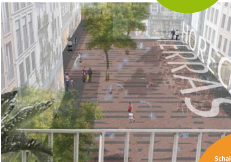
De bouwblokken krijgen een eigen 'binnenwereld'. Zo ontstaat een klein winkelgebied met nieuwe straatjes. Boven de winkels is het prettig wonen.